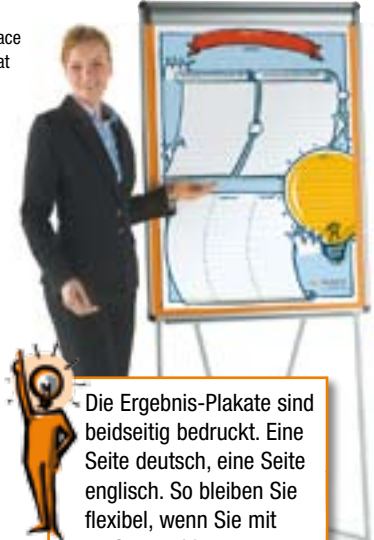
Abb. Open Space Ergebnis Plakat an EuroFlip

Die Ergebnis-Plakate sind beidseitig bedruckt. Eine Seite deutsch, eine Seite englisch. So bleiben Sie flexibel, wenn Sie mit großen und heterogenen Gruppen arbeiten!